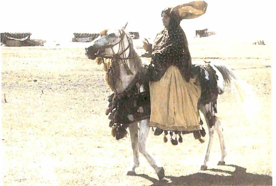
Yöresel kıyafetli atıyla bir bayan